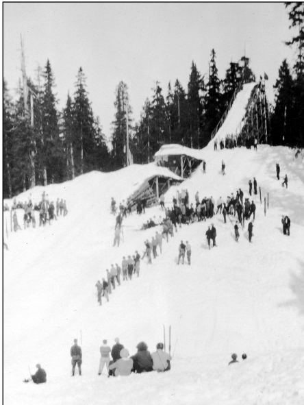
(Above) The First Lake Ski Jump at Hollyburn Ridge north of Vancouver at the Hollyburn Pacific Ski Club Tournament, 1930